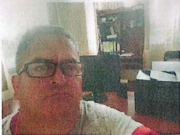
14.- El día Lunes 20 de Enero, movilización prefectura, temas de arreglo de las vías.