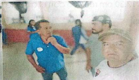
13.- El día Viernes 17 de Enero, oficina.