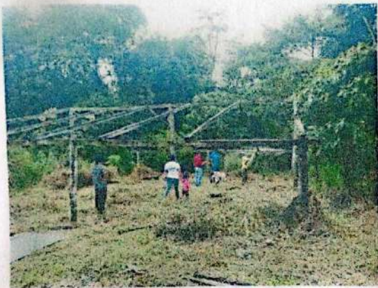
12.- El día Jueves 16 de Enero, colegio Sinaí se realizó un evento de la fundación del CNS.